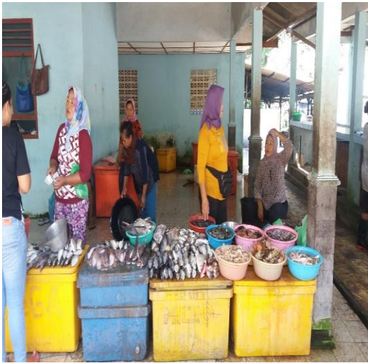
Gambar 1. Tempat Pelelangan Ikan

Peranan pemerintah khususnya Dinas Pariwisata Gunungkidul dapat dilihat dari adanya fasilitas pendukung yang ada di Pantai Baron, seperti dapur umum, Tempat Pelelangan Ikan (TPI) dan lahan parkir yang dibangun secara permanen. Dapur umum ini bisa dimanfaatkan oleh wisatawan yang ingin membeli ikan untuk dimasak di tempat.