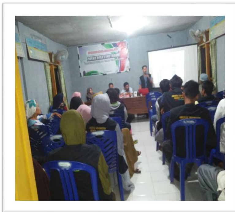
Gambar 1. Penyuluhan pengelolaan potensi hutan mangrove